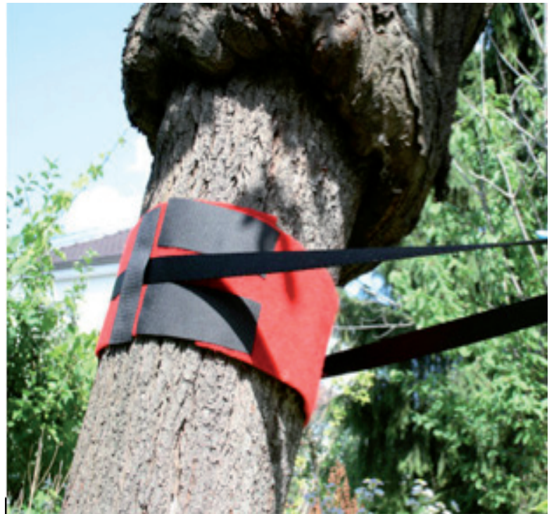
Bandes de protection Slack.fr

Faites attention que vos ancrages soient toujours en contact avec les protections et ne frottent pas l'écorce.